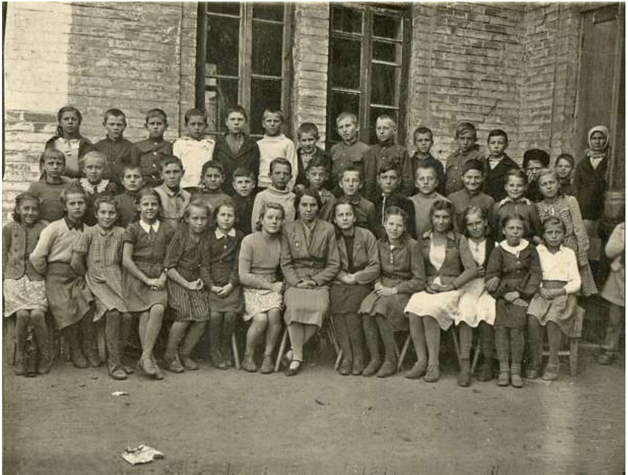
79. Пятый «Б» класс 499 . На обороте надпись моею рукою: «V б кл. С.Ш. № 22 1947 г.». Осень 1947 г.