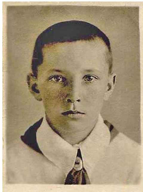
76. Пионер – всем ребятам пример. 4-й класс.

Что-то подобное, помнится, чуть было не случилось и со мною. Не то в седьмом, не то в восьмом классе, меня, отличника и подающего надежды на успешную в будущем «карьеру», тоже «тянули» в пионервожатые. Но что-то там не сложилось – и, слава Богу!