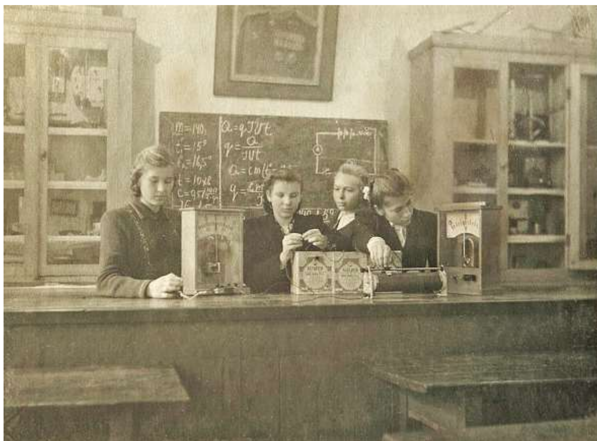
81-3. Школьный кабинет физики. Собираем электрическую схему 522. 1953 г.