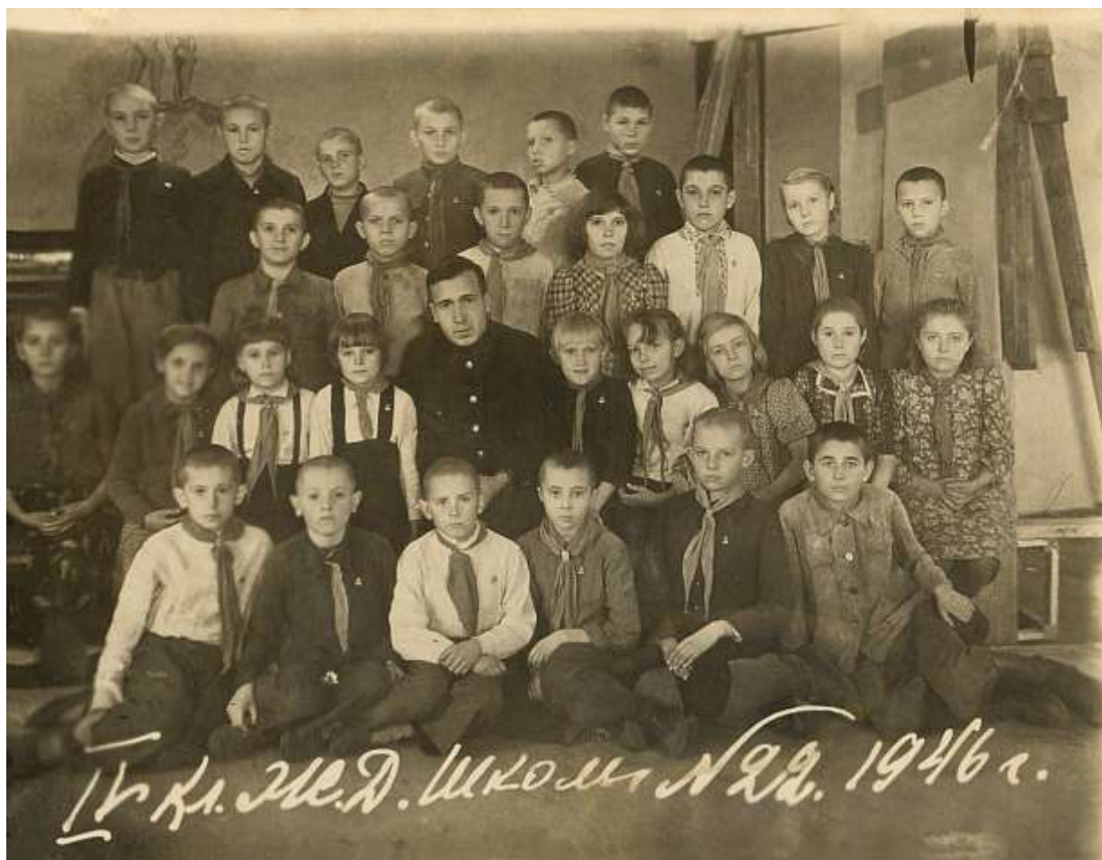
77. Четвертый класс железнодорожной школы № 22 493 . Осень 1946 г.