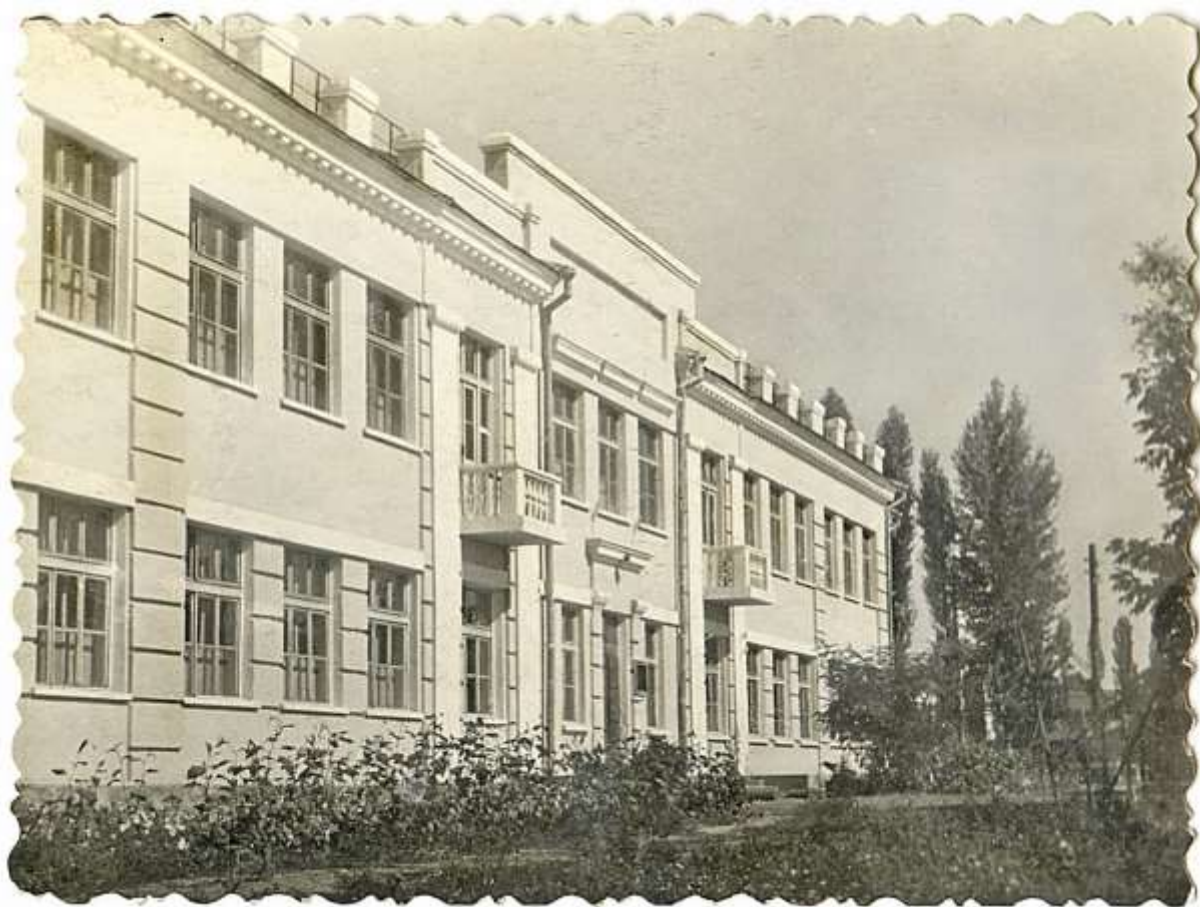
80. Здание средней железнодорожной школы № 22 510 . Конец 1940-х гг.