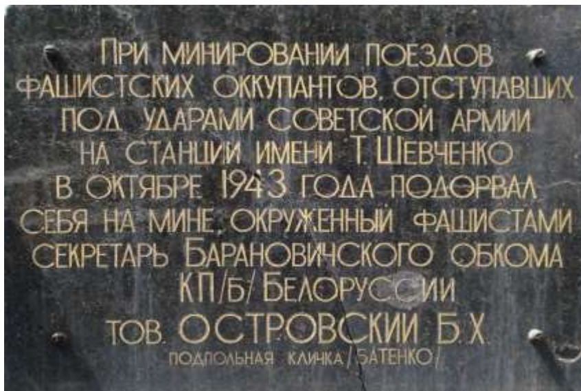
56. Памятная доска Батенко перед входом в вагонное депо. Установлена в конце 1980-х гг.

«Сейчас установлено, что Батенко – это один из довоенных секретарей Барановичского обкома партии Б.Х. Зелинский . Как он оказался на нашей станции, пока остается тайной, которую он унес с собой, подорвав себя миной, будучи окруженным врагами у входа в вагонное депо. О его подвиге железнодорожникам напоминает памятная доска».